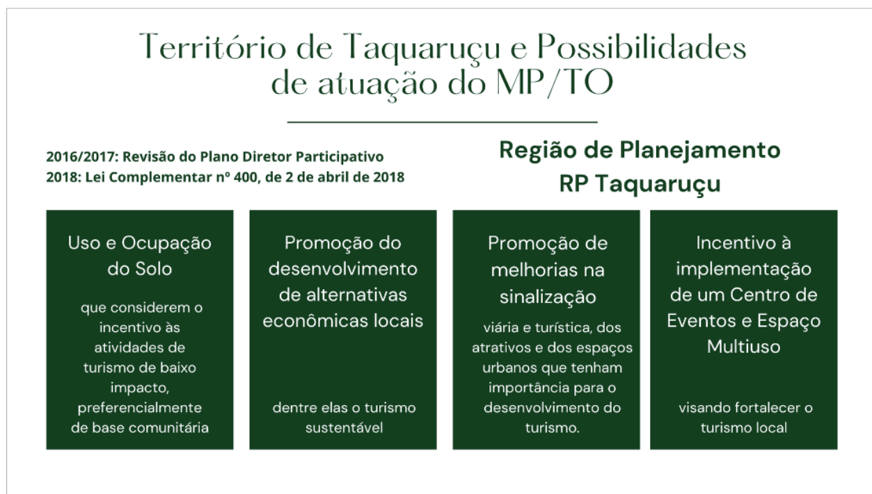
Figura 2: Quadro demonstrativo das diretrizes para a RPTaquaruçu

Nesse contexto, o Plano Diretor Participativo de Palmas, revisado e sancionado em 02 de abril de 2018, através da Lei complementar nº 400, estabeleceu, para a Região de Planejamento Taquaruçu – RPTaquaruçu 8 , o dever de garantia da condição de paisagem cênica diferenciada e atrativa ao turismo decorrente das características naturais da região nos parâmetros de uso e ocupação estabelecidos, bem como as diretrizes de a) uso e ocupação do solo que considerem o incentivo às atividades de turismo de baixo impacto, preferencialmente de base comunitária; b) promoção do desenvolvimento de alternativas econômicas locais, dentre elas o turismo sustentável; c) promoção de melhorias na sinalização viária e turística, dos atrativos e dos espaços urbanos que tenham importância para o desenvolvimento do turismo, e d) incentivo à implementação de um Centro de Eventos e Espaço Multiuso, visando fortalecer o turismo local (Palmas, 2018).